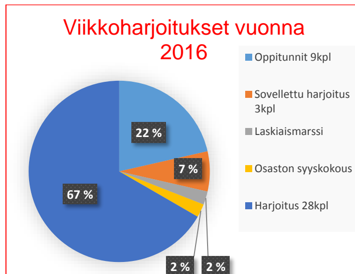
Taulukko 1: Viikkoharjoitukset

Harjoituskerrat jakaantuivat toimintavuonna seuraavasti: