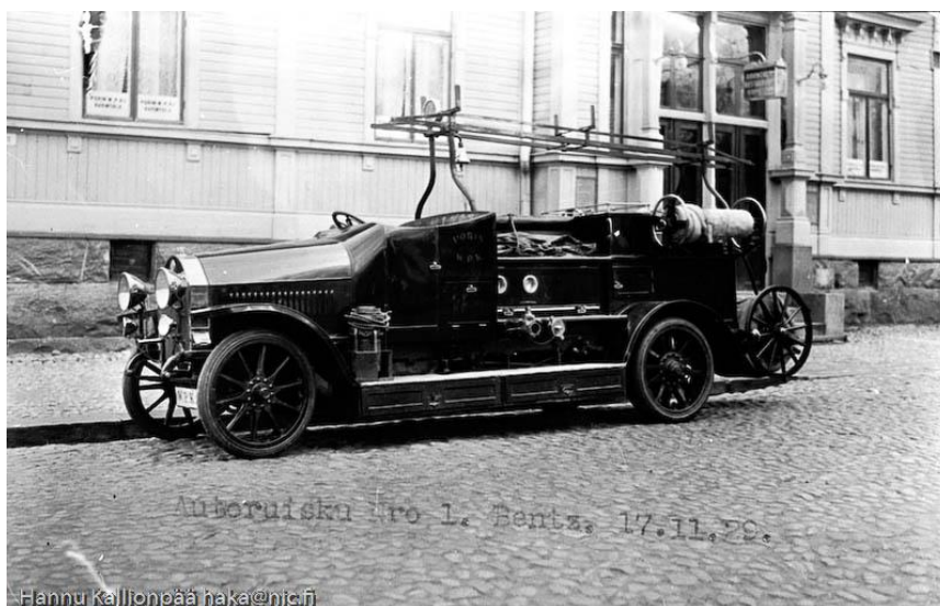
Benz kuvattuna palokunnantalon edessä vuonna 1929.

Miehistö on pääasiallisesti teknikkoja ja pääasiallisesti automobiilin käyttöön ennestään tottuneita miehiä. Palokunnalla on ollut tilaisuus jo useassa tulipalossa koetella tätä ruiskuansa, joka toimi hyvin sekä ruiskuna että vedennostajana”.